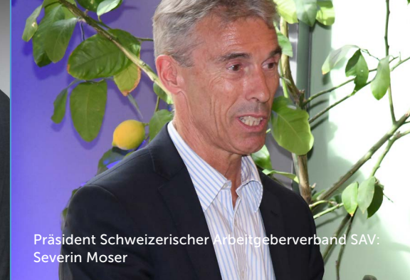
Präsident Schweizerischer Arbeitgeberverband SAV: Severin Moser